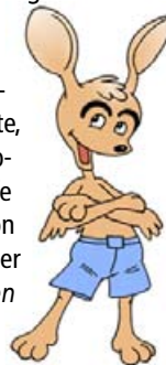
AUDITORIX mit Löffelohren

KK: Die Figur Auditorix hat ihren Ursprung in der Idee, ein Qualitätssiegel für Kinder-Hörbücher zu entwickeln. Sie kam mir in den Sinn, als sich der Markt für Kinder-Hörbücher stark vergrößerte, es aber an einer marktunabhängigen Orientierungshilfe fehlte. In einer Kooperation der Initiative Hören mit der Landeszentrale für Medien NRW entstand dann zunächst eine „Lern-Software“ für die Grundschule, die unter dem Titel AUDITORIX-Hörspielwerkstatt in 60.000 Exemplaren kostenlos an alle Grundschulen in NRW abgegeben wurde. Später wurden die Inhalte der CD-ROM vollständig in die Online-Präsenz www.auditorix.de übertragen und durch weitere Funktionalitäten ergänzt. Erst danach wurde das AUDITORIX-Hörbuchsiegel aufgelegt. Es ist heute eines der wenigen unabhängigen Hörbuchsiegel.