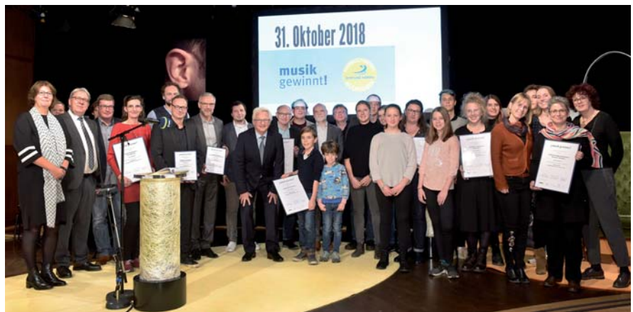
Die Preisträger von „musik gewinnt“.

Ziel des Wettbewerbs ist es, das musikalische Leben besonders engagierter Schulen der Öffentlichkeit vorzustellen, und zwar als Modelle, die andere Schulen musikalisch motivieren und zu ähnlichen Aktionen anregen können. Es geht den Wettbewerbsträgern vor allem um die Breite der musikalischen Aktionen: möglichst viele Schülerinnen und Schüler sollen ihre Schule zu einem Ort des musikalischen Lebens machen. Die in diesem Jahr ausgezeichneten Schulen stachen durch besonders gelungene Kombinationen aus ei-