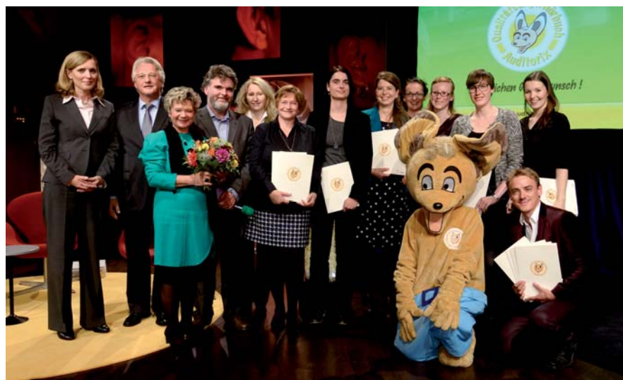
Die Preisträger und Träger des AUDITORIX-Hörbuchsiegels 2014.